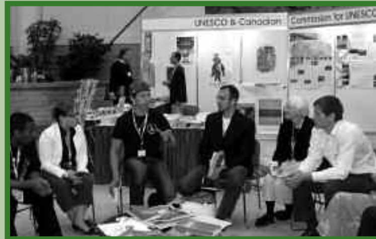
L'UNESCO et la Commission canadienne partagent un kiosque au FUM3

Le Directeur général s'est vu remettre la journée suivante un Doctorat Honoris Causa de l'Université du Québec à Montréal. Dans son discours d'acceptation, M. Matsuura a salué l'engagement de l'UQAM envers l'approche interdisciplinaire, un thème majeur de l'UNESCO. Il a également souligné l'importante contribution du Réseau international UNESCO des chaires en communication (ORBICOM), dont le siège se trouve à l'UQAM, à la libre circulation de l'information aux niveaux national et international.