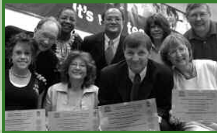
Remise des plaques commémorant le statut d'École associée de l'UNESCO en Alberta

Un groupe de travail pancanadien a produit une brochure décrivant le processus permettant aux municipalités de se joindre à la Coalition. Le groupe de travail y propose une déclaration d'engagements communs et des modèles de plan d'action. La brochure est disponible sur le site Web de la Commission canadienne pour l'UNESCO : http://www.unesco.ca/fr/activite/sciences/default.aspx